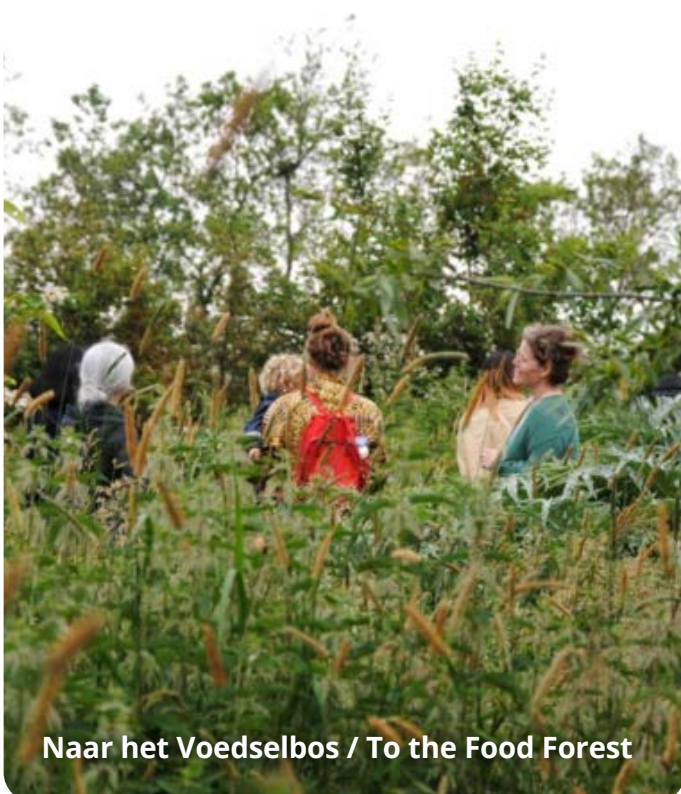
Naar het Voedselbos / To the Food Forest